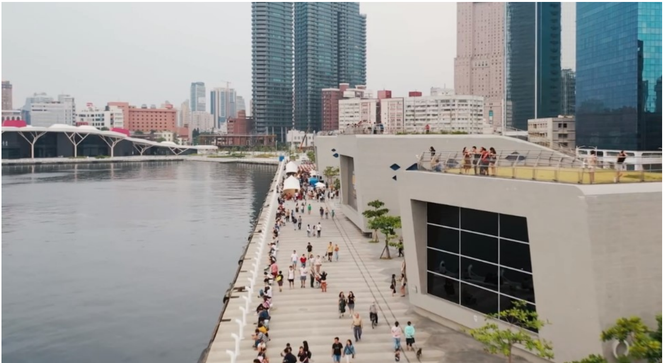
Imagen de la zona 3 del Distrito de innovación de la música pop y la cultura de Kaohsiung,

Además, a este programa se le suman 5 edificios destinados a restaurantes y retail conectados por una pasarela. Estos edificios están conectados por una pasarela, generando una espina dorsal que cose las distintas áreas.